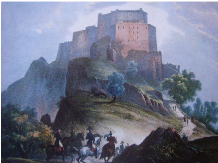
La Sacra di San Michele in un antico dipinto