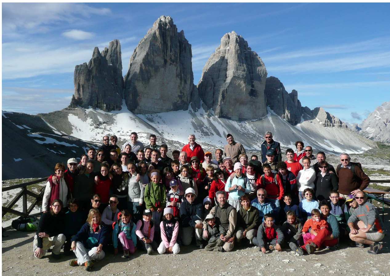
Il gruppone juniors + seniors CAI Seveso al cospetto delle Tre Cime nei pressi del Rif. Locatelli.

Dopo la pausa estiva, l'attività giovanile si concluderà con la castagnata di ottobre.